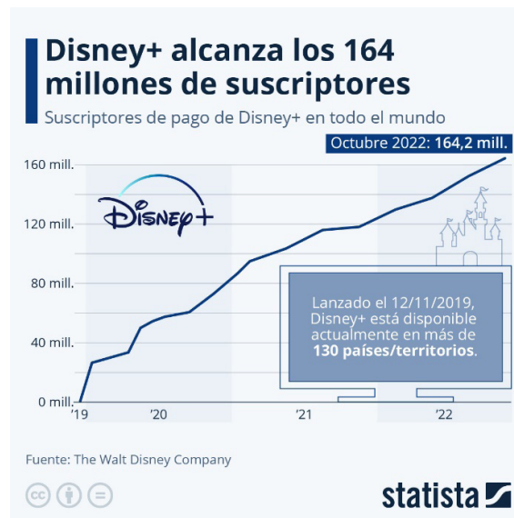
Gráfico nº 1: evolución de los abonados de Disney+

Y en el cuarto trimestre Disney+ volvió a ganar abonados hasta 164,2 millones, sumando 12,1 millones de nuevos abonados, 46 millones más que el año anterior. Entre todas las plataformas del grupo Disney han alcanzado un total de 235 millones de abonados: ESPN+ creció hasta los 24,3 millones y Hulu hasta los 47,2.